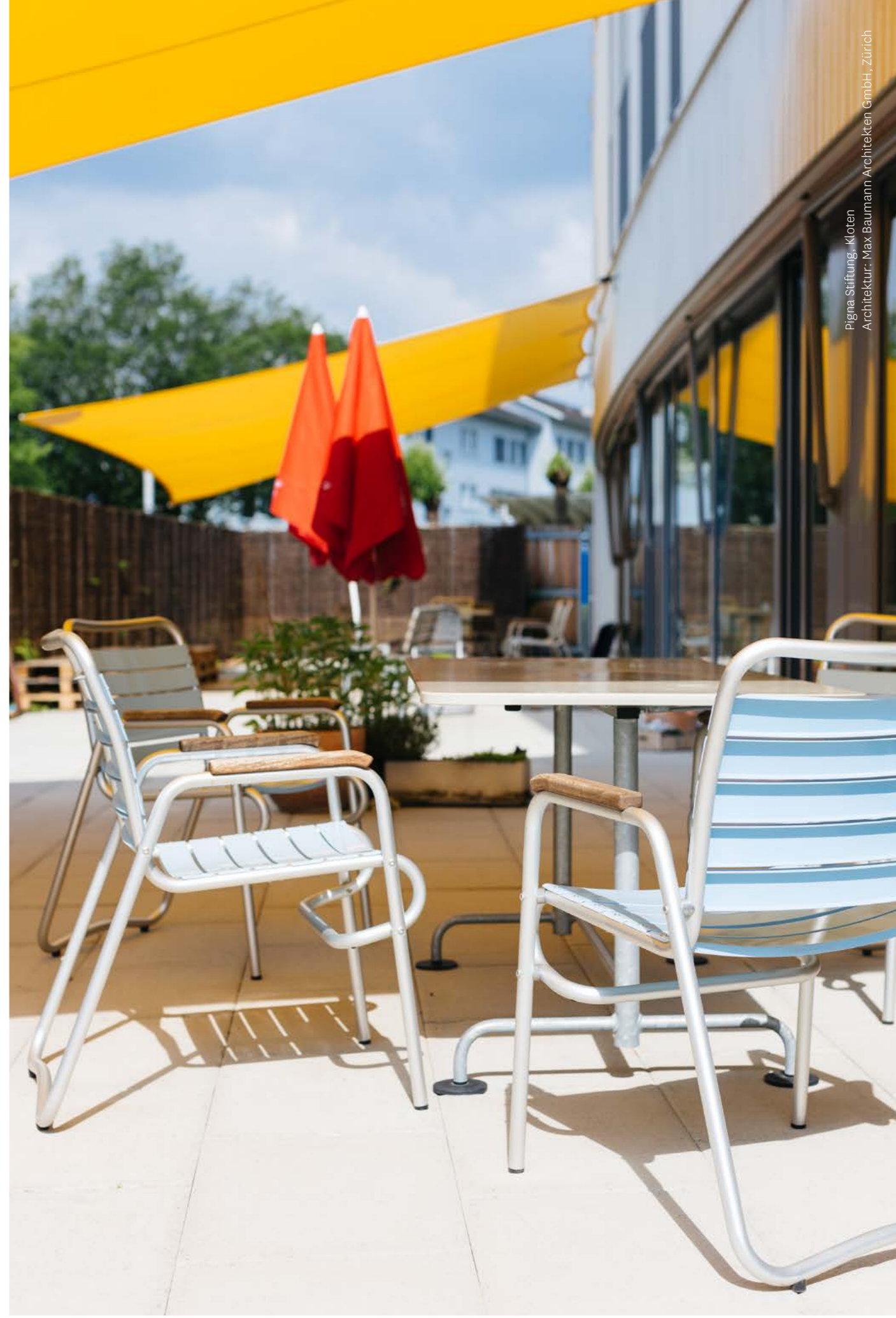
Pigna Stiftung, Kloten Architektur: Max Baumann Architekten GmbH, Zürich