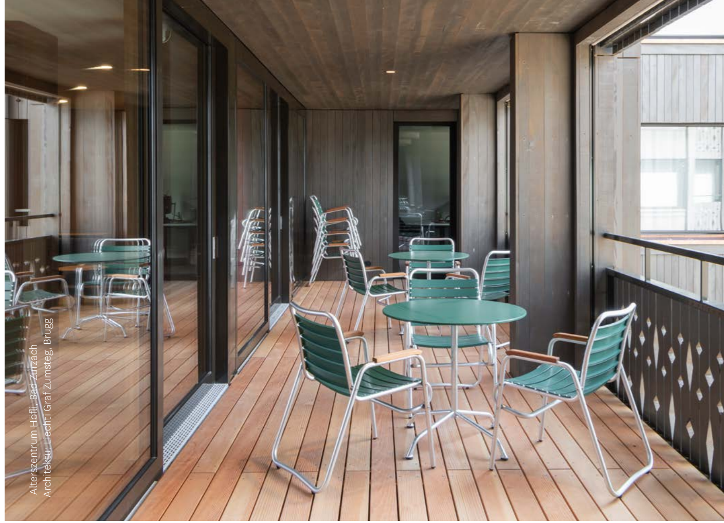
Alterszentrum Höfli, Bad Zurzach Architektur: Liechti Graf Zumsteg, Brugg