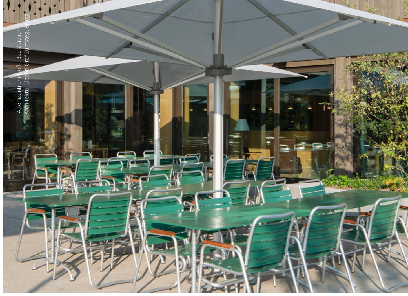
Alterszentrum Höfli, Bad Zurzach Architektur: Liechti Graf Zumsteg, Brugg